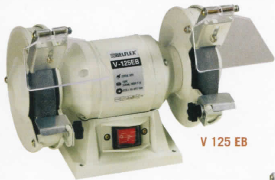
V 125 EB