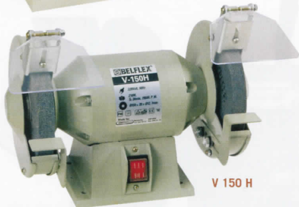
V 150 H