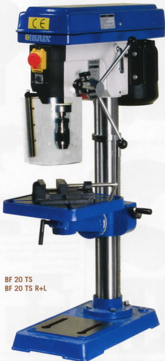
BF 20 TS BF 20 TS R+L