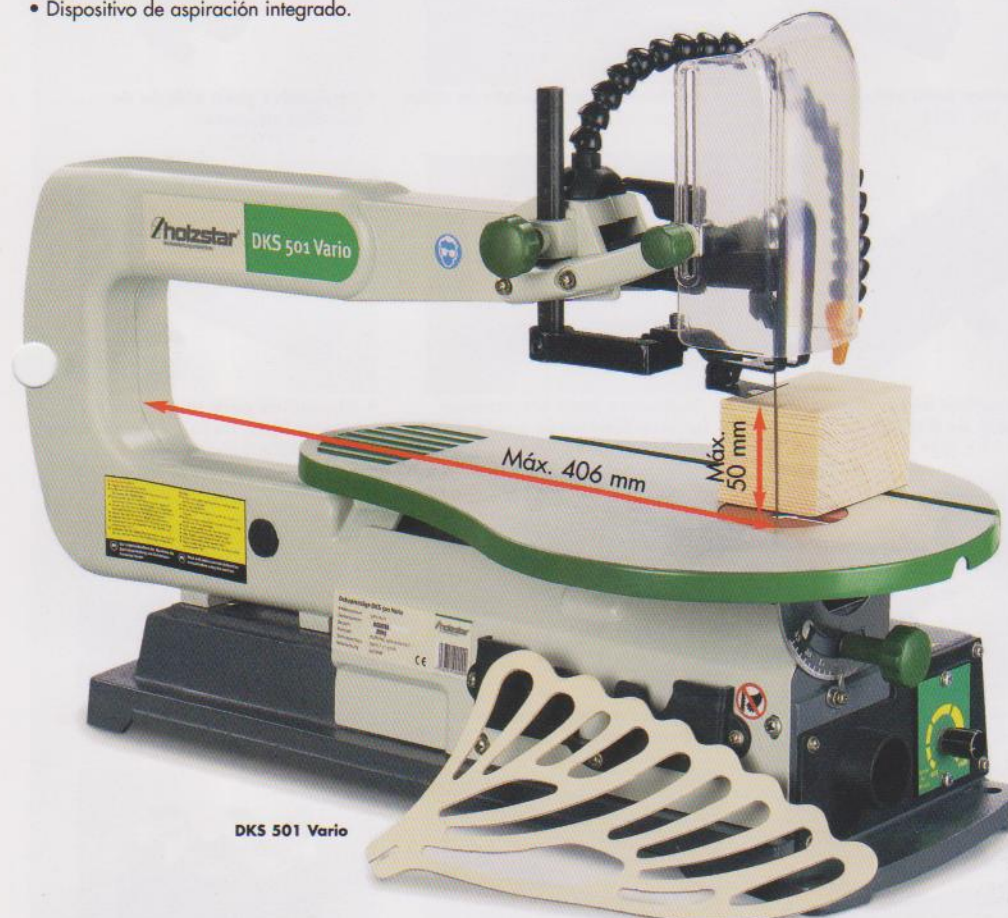
DKS 501 Vario