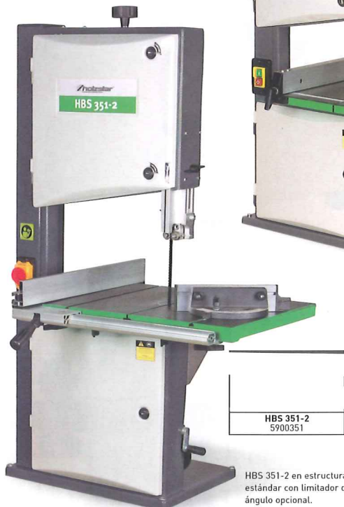
HBS 351-2 5900351

HBS 351-2 en estructura estándar con limitador de ángulo opcional.