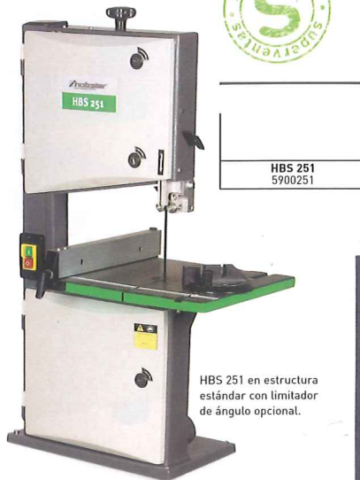
HBS 251 5900251

HBS 351-2 en estructura estándar con limitador de ángulo opcional.