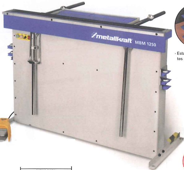
MBM 1250 3770125