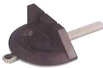
Limitador de ángulo HBS 251