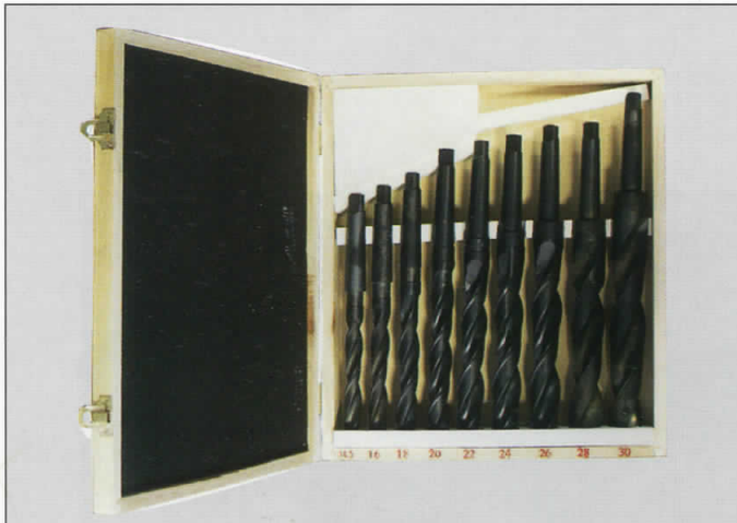
Brocas HSS con mango cónico Código 9 piezas, 14,5/16/18/20/22/24/26/28/30 mm • MK 2 305 1002 • MK 3 305 1003