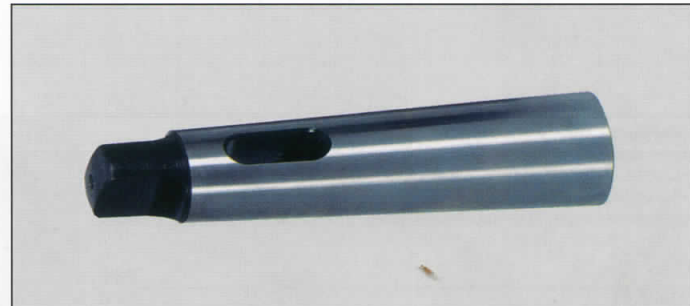
Casquillos de reducción Código • MK 3 - MK 2 305 0663 • MK 4 - MK 3 305 0664 • MK 4 - MK 2 305 0665