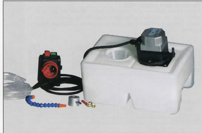
Sistema universal para líquido refrigerante Código P.V.P. Elevación máx. 2,5 m. Cantidad extraída 8 l/min. Incluye depósito, tubo flexible y manguera. Con interruptor/enchufe combinado alemán con inversor de fase. Capacidad del depósito 11 l. Fijación de la manguera de refrigeración con base magnética. Para montaje propio. Dimensiones (l x al x an): 370 x 245 x 170 mm. • 230 V 335 2002 • 400 V 335 2001