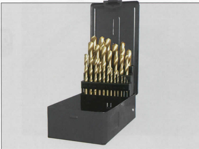
Juegos de brocas titanio Código 1-13 mm. Caja metálica. 25 piezas 305 1010