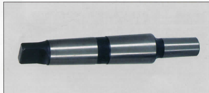
Conos morse Código • MK 2 - B 16 305 0659 • MK 3 - B 16 305 0660 • MK 4 - B 16 305 0661 • MK 5 - B 16 305 0675 • MK 6 - B 16 305 0676